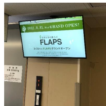
バックヤード 従業員エレベーター前 施設運営に必要な従業員向けコンテンツを配信